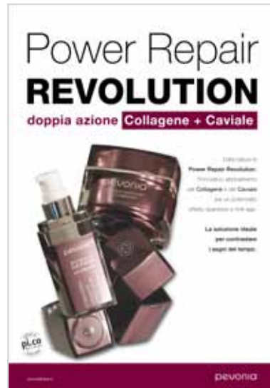
Manifesto cm. 70x100