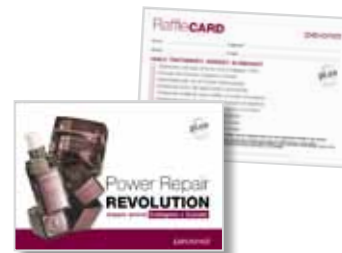
Cartolina Raffle Card