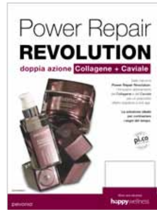
Pannello da tavolo