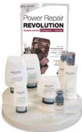
Visual per Display da Banco